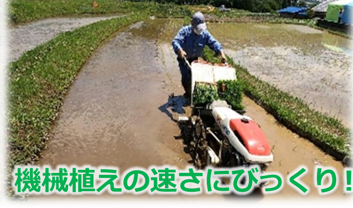
機械植えの速さにびっくり!!

手植え作業は1時間半ほどで終了することができましたが、長時間腰を曲げる動作や普段使わない筋肉を使つての作業に加え、当日の強い日差しが私の体力を削り取ってしまいました・・・。（みなさんも田植えをする時はこまめに水分補給をしましょうね。）改めてお米を作っている農家の方々のご苦勞を感じました。そんな中、田植えの最中には、オンライン講座で紹介したカエルやオタマジャクシなど様々な生き物を見つけることができました。