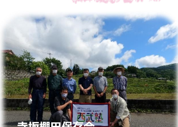
寺坂棚田保存会 横瀬町役場振興課の皆さん

苗を手で植えるのは大変な作業でしたが、一つ一つ心を込めて植えた苗が大きく成長しておいしいお米になるように祈りながら手植えを行いました。